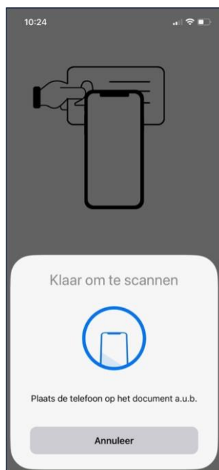
Figure 2 Klaar om te scannen